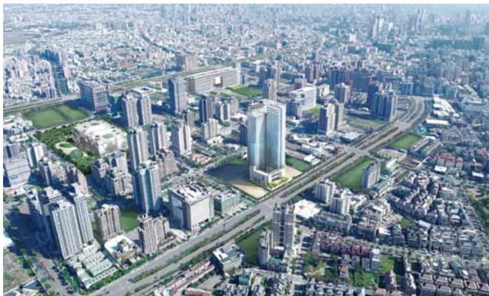
台中市七期重劃區鳥瞰合成示意圖

Autodesk AutoCAD Design Suite Premium 為 Autodesk 開發的最佳化設計工具組合包，長期提供產業領先技術的繪圖工具，歐特克為了讓產業公司的創意者無後顧之憂、專注於優質的創作上，將每一種繪圖產業所運用的工具重新賦予其重要的身分，識別它們在正確工作流程上所必須發揮的價值。因此歐特克創新推出可廣泛應用於各產業的設計工具組合包—Autodesk AutoCAD Design Suite Premium，從創意發想到完美呈現，包含軟體有AutoCAD、SketchBook、Showcase、Mudbox、3ds Max Design。