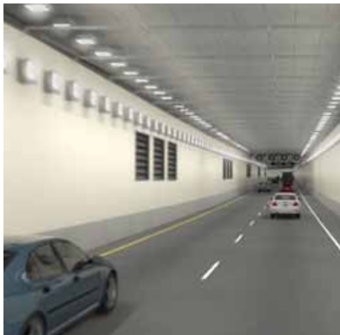
Recorrido del túnel excavado. Imágenes, cortesía de WSDOT/Parsons Brinckerhoff.

Para mayores informes, visite latinoamerica.autodesk.com/gobierno y latinoamerica.autodesk.com/bim .