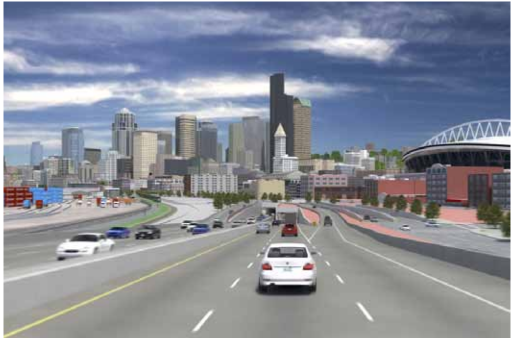
Acercamiento a la entrada sur del túnel excavado.

Parson Brinckerhoff utiliza las soluciones de Autodesk BIM para desarrollar y visualizar diseños del viaducto Alaskan Way.